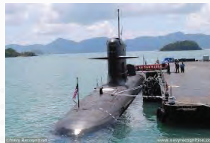
Rajah 3 : Badan kapal selam merupakan struktur kritikal yang perlu diberi perhatian kerana sentiasa terdedah kepada risiko pengurangan.

Manakala ujian ultrasonik adalah penggunaan gelombang frekuensi bunyi bagi menilai sesuatu bahan. Selain daripada mengesan kecacatan, ujian ini juga dapat digunakan untuk mengukur ketebalan. Secara prinsipnya bunyi yang dihantar adalah sama keamatannya apabila diterima. Jadi sebarang pengurangan keamatan yang diterima menunjukkan keabnormalan pada sampel tersebut. Teknologi ultrasonik yang terkini dapat menukarkan keamatan bunyi kepada imej menyebabkan aplikasinya semakin mendapat tempat dalam industri minyak dan gas serta perubatan. Antara aplikasi yang digunakan adalah pada struktur sayap kapal terbang dan badan kapal selam. Kapal selam yang terdedah kepada risiko pengurangan boleh mengundang bencana sekiranya pemantauan ketebalan tidak dilakukan, ini ditambah dengan cabaran seperti ketebalan yang tinggi, rekabentuk yang kompak dan sukar diakses (Rajah 3). Namun begitu, dalam ketenteraan, aplikasinya masih lagi terbatas disebabkan kekangan komponen yang mempunyai saiz yang terlalu tebal, pelbagai variasi bahan dan rekabentuk yang kompleks. Teknologi termaju ultrasonik terkini dapat menukarkan isyarat bunyi yang diterima kepada imej yang mana banyak membantu dalam mendapatkan bentuk kecacatan dalam struktur atau komponen yang dianalisis.