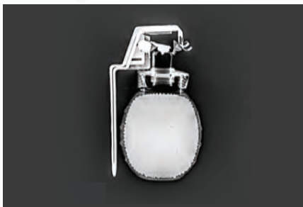
Rajah 2 menunjukkan imej radiografi digital sampel bom tangan grenad.

Ujian radiografi telah meluas digunakan kerana berkemampuan untuk mendapatkan imej bagi sampel yang dicerap. Dengan menggunakan sumber sinar-x atau radioaktif, sinaran mengion yang terhasil mampu untuk menembusi sesuatu bahan. Sinaran yang menembusi bahan akan menyebabkan perbezaan kontras ketumpatan dan akan ditukarkan kepada imej. Imej yang terhasil ini, dapat membantu untuk mengesan sebarang abnormal yang berlaku pada struktur dan komponen dalaman. Selain itu, sinar-x juga dapat membantu ketika menjalankan penyiasatan kegagalan dan analisis forensik. Pada masa sekarang radiografi digital seperti plat digital dan Computed Tomography (CT) banyak digunakan dan dijangka terus berkembang pada masa akan datang. Kaedah ini akan menjadikan proses ujian menjadi lebih pantas, resolusi imej yang lebih tinggi dan keputusan segera dapat dicapai semasa di lapangan lagi. Rajah 1 menunjukkan peralatan CT yang mampu menghasilkan imej tiga (3) dimensi untuk pelbagai komponen aset. Dalam hal ini, berbeza dengan aplikasi perubatan, analisis imej hanya dilakukan ke atas objek manusia sahaja dan tenaga (kV) yang diperlukan adalah rendah. Namun bagi aset tentera, sampel yang terdiri dari pelbagai jenis, memerlukan tenaga yang tinggi supaya sinaran mengion dapat menembusnya. Tidak terhad di situ, ujian radiografi juga dapat diperluaskan bagi kajian integriti struktur ke atas senjata dan bahan letupan (Rajah 2).