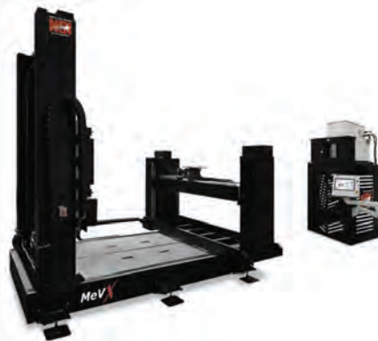
Rajah 1 : Peralatan Computed Tomography (CT) yang boleh mencapai tenaga sehingga 9 MeV mampu menghasilkan imej 3 dimensi untuk sebarang komponen.